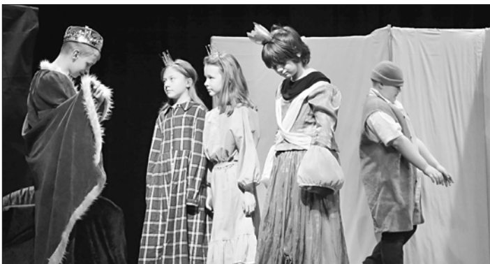
PŘEDSTAVENÍ Bajaja v podání souboru Krvavej flek ZUŠ JJR zaujalo množství diváků na okresní divadelní přehlídce literárně-dramatických oborů, která proběhla v SC Rožmitál.

Pokud se základní hudební předpoklady neprokáží, jsou u nás další umělecké obory, jejichž náplň potřebuje zase jiné vrozené schopnosti, které dítě může mít. Tyto vám budou s odbornou diagnostikou jejich vyučujících doporučeny. Nestává se, že by dítě nemělo předpoklady k žádné aktivitě. Zaregistrujte se na našich stránkách k přijímacím pohovorům klidně ve více oborech, vybereme pro vaše dítě ten nejlepší. za HO MgA. Vladimíra Štěpánová