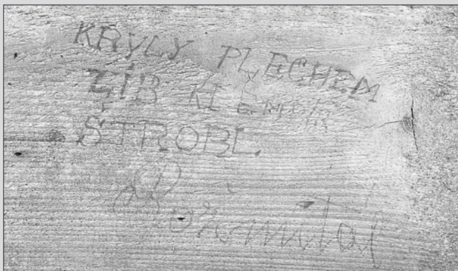
Kryly plechem Zib klempíř Štrobl Rožmitál