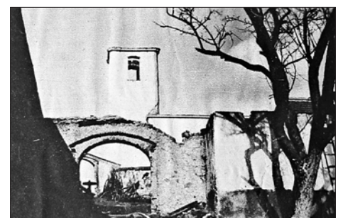
Kostel po požáru v roce 1933 v Pražském ilustrovaném zpravodaji

kostela a pak i starobylý kostel. Věž kostela je ze čtrnáctého století a byla kryta kulatým šindelem. K požáru sjely se hasičské sbory z celého okolí i z Prahy. Hasiči ze sousedního města Březnice, kteří právě měli svůj ples, přijeli hasit v plesových úborech. Byly obavy, že požárem lehne celý Starý Rožmitál, jenž má skoro vesměs šindelové střechy. Na štěstí vál vítr na opačnou stranu. Vody na hašení požáru se spotřebovalo tolik, že blízký rybník byl skoro úplně vyčerpán. Požár byl jako obvykle založen.“ (jir)