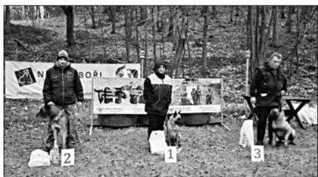
Vítězové v kategorii ZM