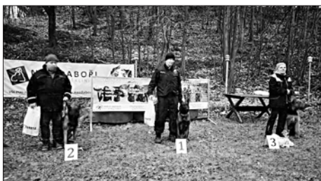
Vítězové v kategorii ZVV3