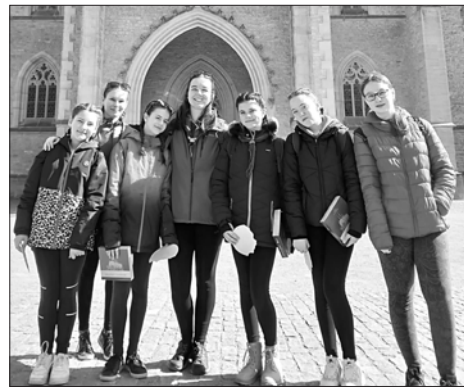
počasí přálo a stalo se to tak vydařenou jarní procházkou. Skaut Rožmitál

Naši kluci i holky během měsíce března vyrazili hned na několik výprav. Mladší posádka, Kačenky, Rysi a Pomněnky, vyrazila na společný víkend do Kutné Hory. Zde poznávali krásy města, utužovali své přátelské vztahy a zamířili i do místního muzea lega. Kutná Hora se zalíbila i družině Kopretin, která se sem vydala obdivovat místní krásy hned týden po nich. Jako první však na výpravu vyrazily Včelky, a to na jih do Čížové u Písku, kde naopak objevovaly místní přírodu nebo si zkoušely samy vařit. Aby výlety byly kompletní, tak neotálely ani naše nejstarší družiny Tygrů a Žabek a vyrazily na výšlap do Brd, kdy jim