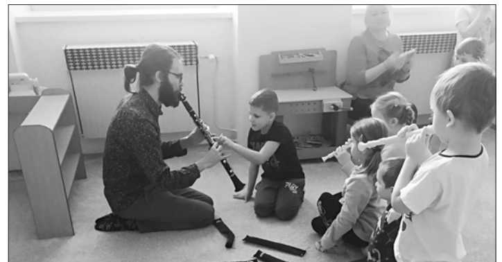
UČITELÉ dechových nástrojů představili své dovednosti žákům Mateřské školy a Základní školy Věšín. Zavítali i do rožmitálských školek a uvidíte se s nimi i během zápisu do ZŠ Rožmitál.