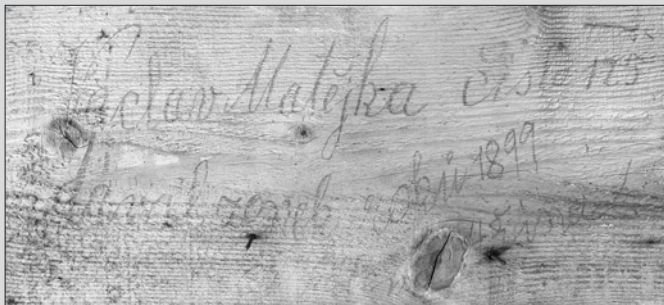
Václav Matějka číslo 125 dával z(v)onek ve Věšíně roku 1899 4.řína