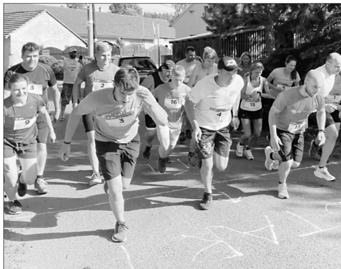
Snímek připomíná loňský ročník oblíbeného Běhu Olympijského dne v Hudčicích.