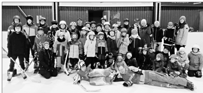
Ve středu 15. ledna byl 7. ročník společně s 2. B bruslit na zimním stadionu v Příbrami.