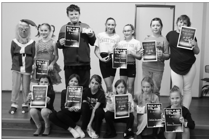
Účastníci soutěže Škola má talent.