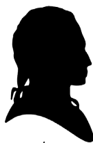
Jakub Jan Ryba

V sobotu 11. ledna se uskutečnil Tříkrálový koncert, kde na jedné straně bok po boku vystoupili žáci a učitelé ZUŠ JJR, a na straně druhé se v rožmitálském kostele výjimečně na této události představili žáci tří oborů – hudebního, tanečního a literárního dramatického. Společně nastudovali Rybovu hru z roku 1804 s názvem Radovánky nevinných dětí o Vánocích. Tímto krokem jsme tak slavnostně odstartovali Rybův rok 2025, v němž nás čeká další spousta podobných radostí. Kromě výše jmenovaného společného scénického počínu patřil Tříkrálový koncert mladým zpěvákům, kteří si připravili několik Rybových písní (například Šťastný koledníček apod.). Pozadu nezůstali ani naši učitelé, kteří již delší dobu zkoušejí rozličný pěvecký repertoár, a v rámci tohoto koncertu zaznělo další Rybovo dílo pro sóla, sbor a orchestr (Aria Pastorella na Tři krále). V současné době pro vás připravujeme záznam jednotlivých vystoupení, kterým vám chceme zprostředkovat slavnostní dojem a umělecký zážitek. Těšíme se, že nás navštívíte během dalších připravovaných vystoupení a koncertů. Připravovaný program bude bohatý.