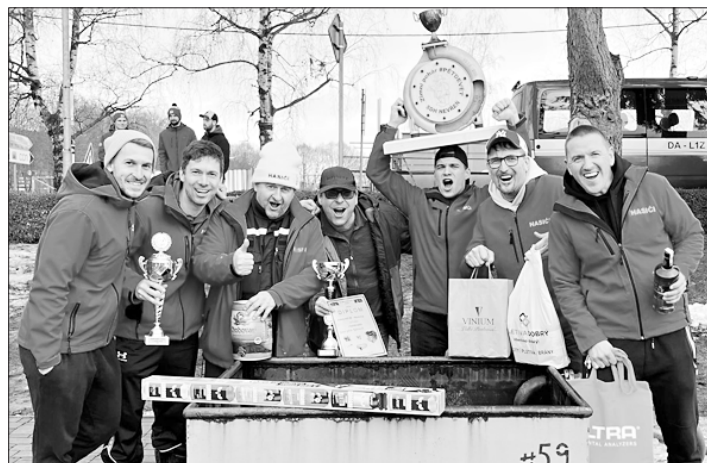
Vranovičtí hasiči na soutěži Icecup Nevřeň 2026